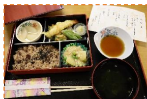
敬老祝賀会の祝膳