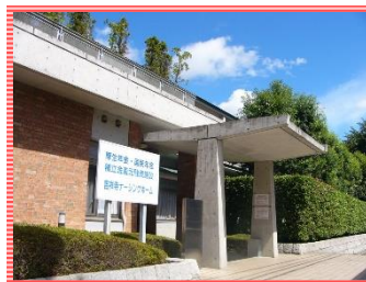
吉祥寺ナーシングホームデイサービスセンターリーフレット: 在宅-案内-007(R4.6.1)