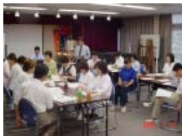
内部品質監査員研修風景 吉祥寺ホームでは、毎月1回業務改善委員会の中で、内部品質監査を実施しています。

では、チェック表がきちんと書かれているからといってそれだけでよいのでしょうか。近年、大企業が失敗した一連の不祥事は、品質管理の仕組みが出来ている事に安心して、本当にその通り行われていたかどうかの、現場におけるチェックがなされていなかった事が上げられます。吉祥寺ホームでは、まだ内部品質監査を始めたばかりですが、現場主義の考えをシステムに組み入れながら、サービス向上に生かして行きたいと思っております。