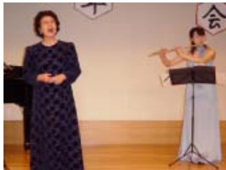
養護老人ホーム忘年会ア`リス`演奏 http://www.geocities.co.jp/MusicHall/3434/

住所：〒180-0001 東京都武蔵野市吉祥寺北町2-9-2 電話：0422-20-0800(代表) Fax：0422-20-0897 ホームページアドレス： http://www.kichijoji-home.com