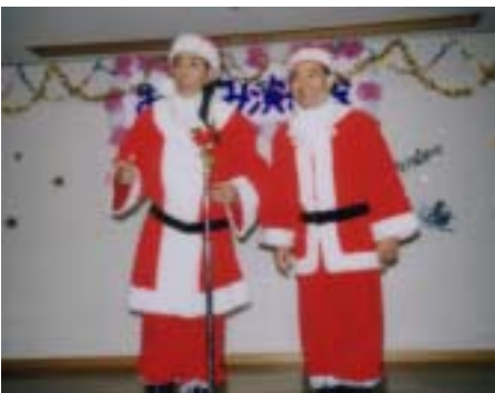
はぐれ刑事純情派ロケーション 吉祥寺ホーム集会室にて