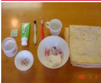
ナーシングホームの 口腔ケアで使用する用品

何よりすっきり、さっぱり爽快になります。そして誤嚥性肺炎の防止になります。誤嚥性肺炎とは、口の中に残った食べカスが気道に入り、むせたり知らない間に肺炎を起こしたりするものです。口の中が健康だと食事が美味しくなり、全身の健康につながります。