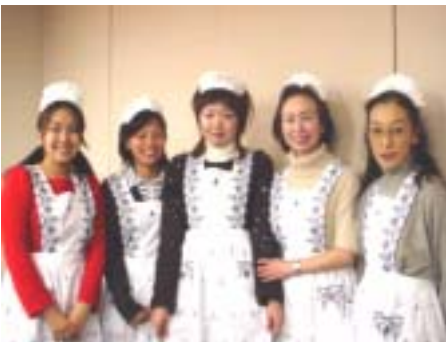
デイサービスクリスマス忘年会 ボランティアの学生さんとスタッフ