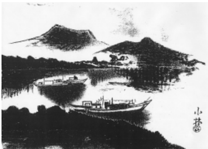
絵 小林 善作

地元の人が和船で付き添ってくれる。クロールは体力を消耗させるので、平泳ぎだ。コースを外れない様、必死に和船についてゆく。