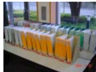
吉祥寺ホーム サービス・業務手順書

吉祥寺ホームでは、品質マネジメントシステム（以下QMS）の考え方にに基づき、サービス・業務の手順書を作成しています。そしてその手順書に基づき、様々なチェック、研修を行いサービス・業務の品質管理を行っています。